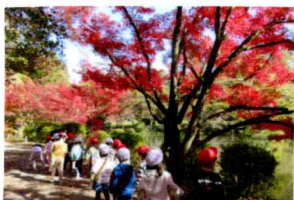
おちばもまあるく