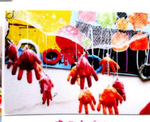
たこやきコーナー