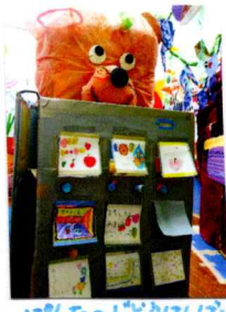
ぼんたのじどりほしあいき