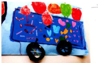
くだものばっやがばいります。