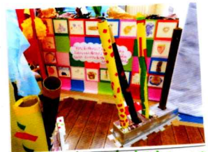
ほくのわたしの犬さきものは?