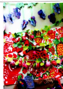
いちごがりや ぶどうがりや おいも祭り