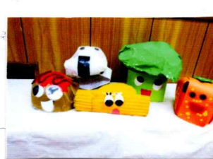
どれもかきまわす

お弁当の具材を 頭にかぶってバスに ご乗車下さい♪ 秋の果物やおいもも 作ったよ!! おいしく食べてね!