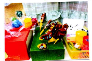
おまつりごっこでたのしみながら つくったよ。