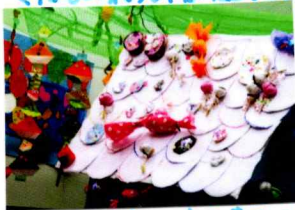
ゲームのオマケのつばあまい おかしでいっしょ