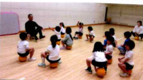
リーダと 体育あそび