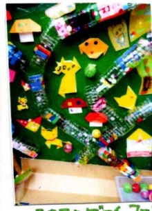
ゴコロゲームコーナー