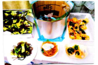
たまごばに ラーメン たこやき

くだもの木をねらう、おいも ザウルス!! 他にもハンバーガーにポテト、 いちご狩りコーナーなどなど 大好きな食べ物をいっぱい作 ったよ♪食べに来てね!