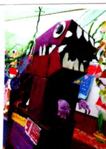
ガオ おいもザウルスだよ。