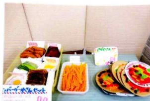
ハンバーガー ポテトは いかにする? コーナー