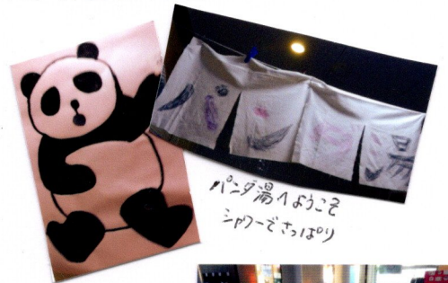
パニダ湯いぶごそ シメーどまほり