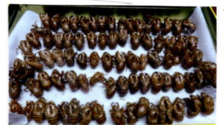
セミのぬけがら こんなに

きりんさん達が育てている百日草が色とりどりに咲いています。夏の暑さにも負けずに次から次に蕾を付け花が咲き続けています。