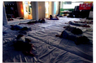
ホールで みんないっしょに ねむったよ