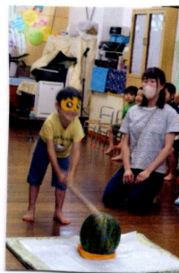
エーイ スイカ割り