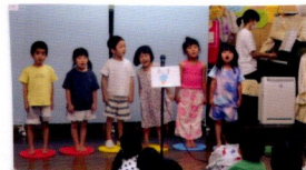
おジャ かオケ 大会