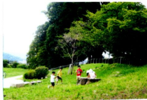
小学生にはこのクラブ