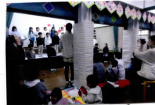
♪ ラテツキー行進曲 ♪