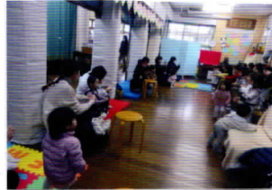
うさぎ組の おにいさん おねえさん 手遊びと いっしょにね