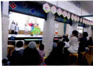
「しろくまのパンツ」

きりんさんはラテツキー行進曲」の合奏や楽器の紹介などを、ぱんださんは「しろくまのパンツ」の劇遊びをしてくださいました。うさぎさんは小さなお友達に手遊びを紹介。小さなお友達も一緒に手遊びを楽しんでくださいました。きりん組のお友達が作ってくれたアンパンマンをお土産に！小さなお客様も大喜びでした。