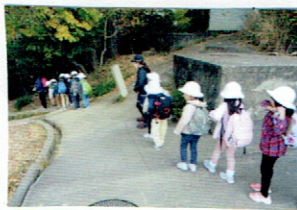
長えかけて おひょう！！