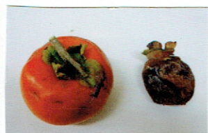
とれたての柿 干し柿にした柿