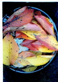
美しい色の桜の葉