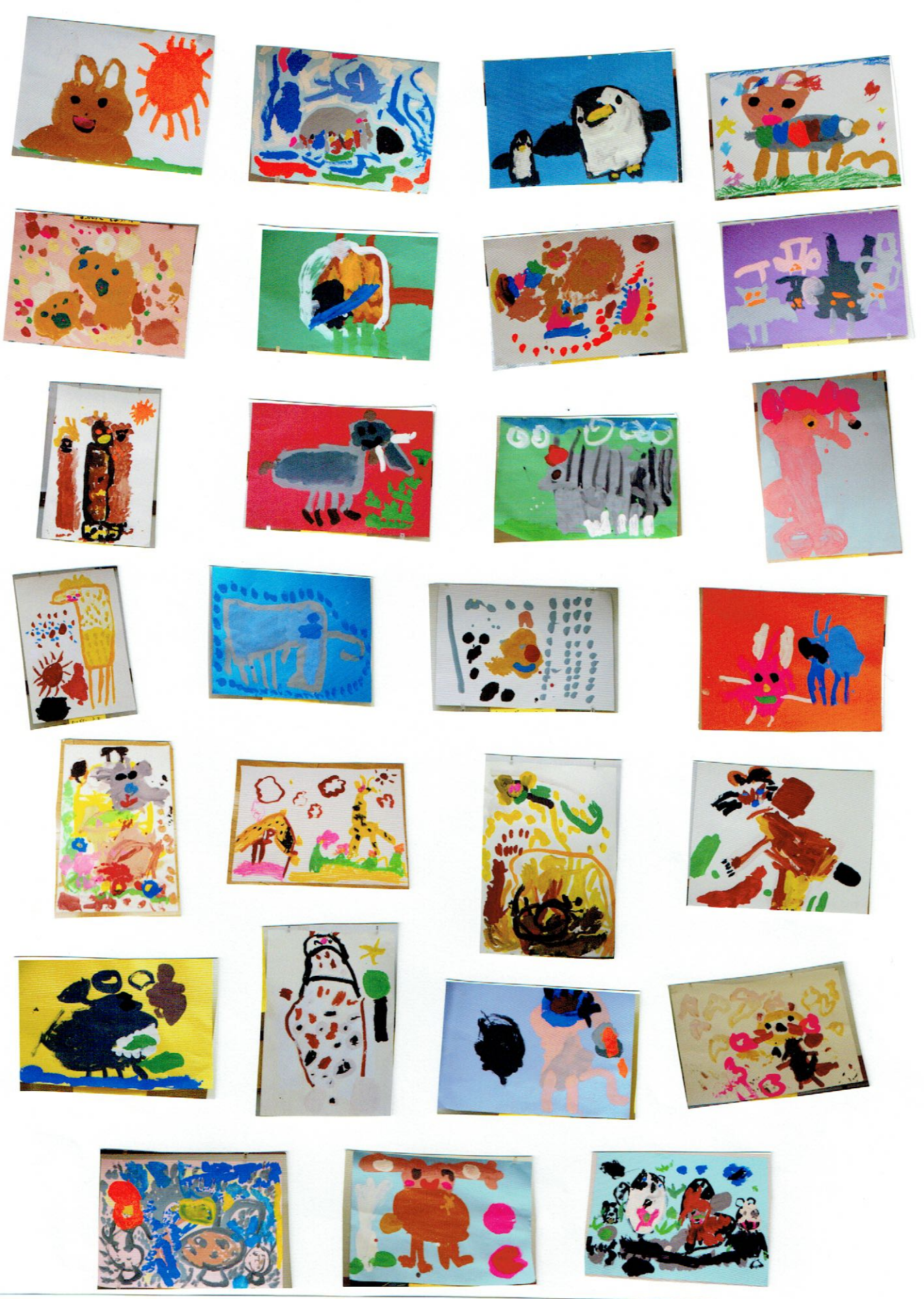
ぱんだ組 ぼくたち わたしたちの 大好きな動物たち