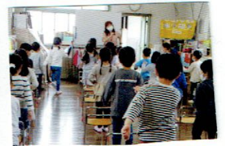
英語を遊ぼうかほじりました