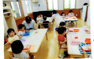
お昼は、密をさけてゆつりと。