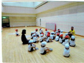
リズムのほじまりました。