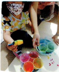
染め卵をしようよ。

ぱんだ組（年中4歳児）は登降園もお部屋二階です。階段の上り下りにも慣れて、お庭や屋上やお部屋で元気に遊んでいます。