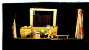
がんばれペロバー