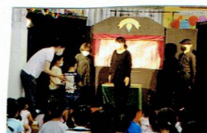
ありがとうございました。