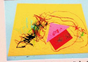
(おうちのちかくにへびがいる)