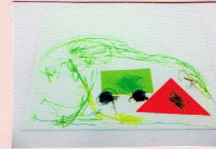
(おうちと バスと みちだよ)