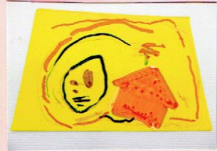
(はなまるこちゃんのおうちから あめがふってきた)