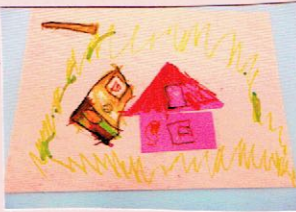
(むらちと たまごちゃんのおうち)