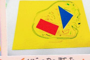
(くじらのなかまたち みんなでいっしょにいるの おあそびのむいいるよ)