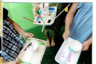
新聞紙と色紙 (2歳・3歳)