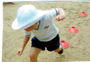
ピョンピョン 向とめて。