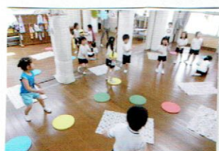
合図とよびかいて 動くよ！