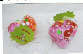
お母さんに プレゼントしよう！