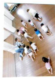
かたつむりに 変身