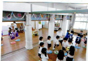
みんなまで 動きをみせて。