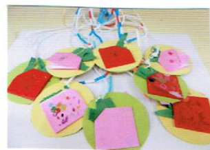
お礼のペンダント お母さんありがとう