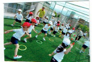
リーダーと一っしょに いろいろな運動を 下のしもう！！