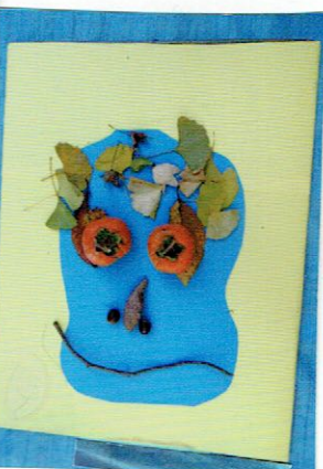
よめしている おもしろいかお