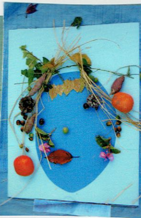
ゴムをくったり みつあみして おしゃべりしているかお