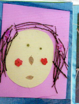
ママとあそんで わらっているかお