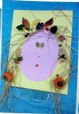
ほったおゆが おおきて ピック したかお