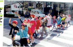
信号をたしかめてスムーズに渡りましょう。青でも油断をせずに、ちゃんと渡ります。