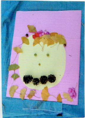
かみてあそんで わらっているかお