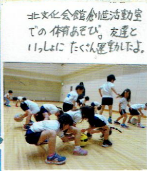
北文化会館倉庫活動室での体育あそび。友達と11人ほどにたくさん運動したよ。