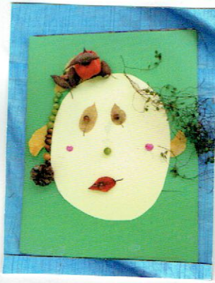
おかあさんがだいすきで だきついているかお

tupera_tupera のおふたりによる提案をベースに幼稚園のお庭で取り組んだきりん組の作品