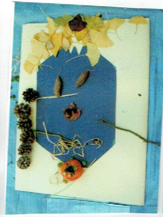
トランプをいして 「もう かさそう!!」って よろこんでいるかお