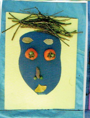
しゃんとってたら めがとびだしたかお