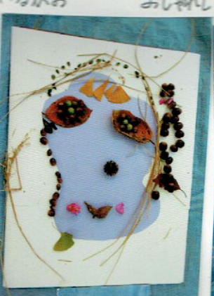
おでかして うれしいかお