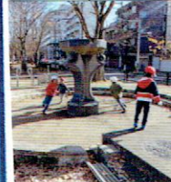
いろいろなどころへ散歩にでかけました。