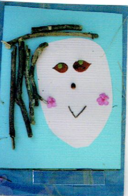
ピロピロにいつて たのしいかお