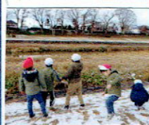
雪がつもりました。