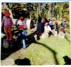
公園や植物園たくさんお出かけしました。