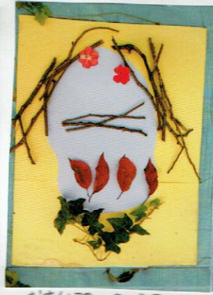
おでんがしなから 「ちと かかしくなれたあか って おもっているかお