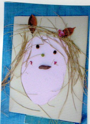
おどりとあそんで ニコニコしているかお