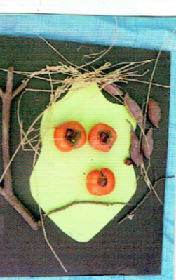
テレビを みまぎて めだまが とびだしたかお