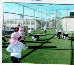
屋上への階段もへっちゃらで登れるようになりました。お友達といろいろな遊びを楽しんでいます。