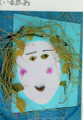
なわとびであそんで たのしいかお