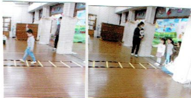
「右、左をよくたしかめてから、道にでましようね！」