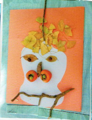
ちんまげして よめしている アマガにすむ おじいさん