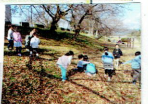
賀茂川は遊びの宝庫。