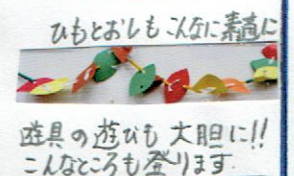
ひもとおしもみんな喜んで遊具の遊びも大胆に!! こんなところも登ります。