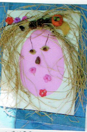
ハロハロのおどりをみて わらっているかお