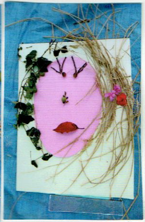
かきくちゅうえんちで あそんでうれしいかお