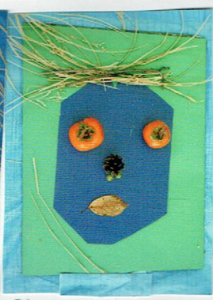
「きんぎょがいる!」とおもって ピックしているかお