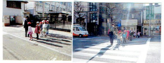
きりんさんとはんださんは、実際に道を