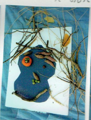
えいがをみてたら おもしろくて めがとびだした。ちかちかして そのりきおりでちんまげあはれたかお