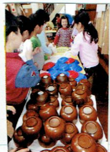
あとかたづけも自分たちで！