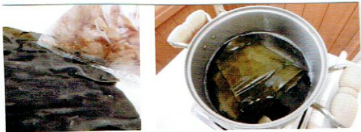
お出汁は昆布と鯖節

本格的なだしを取り方を伝授いただき、用意してくださった最上級の昆布と鯖節でおだしをとりました。当日は朝から大忙し。幼稚園にお出汁の匂いが立ち込めると「いいにおい」「おつゆのにおい」などの声が聞こえます。きりんさんは大根や人参を切って煮ます。ぱんださんはこんにやくの係です。くにやくにゃくのこんにやくを包丁で三角に切って煮ます。昆布と削り節のおだしはなんともいいお味。煮る前にきりんさんはお出汁も味わいました。うさぎさんは、ちくわをナイフで半分に切りました。ことりさんは野菜を洗ったりソーセージを袋から取り出してくれました。ぱんださんときりんさんが鶏卵の皮をむいてくれました。うさぎ組さんは鶉の卵の皮むきです。鶏ささ身肉も入れて一緒にことごとにつめておでんの出来上がり！！おつゆまで飲み干すお友達もたくさんいました。おかわりもしておなかいっぱいになりました。デザートにみかんやりんごジュースもいただいて満足満足。後片付けはきりんさんたちが手伝ってくれました。