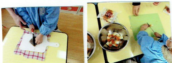
こんにやくを切ります