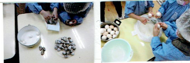
卵の皮むき うさぎ組は鶉卵 きりん組ぱんだ組は鶏卵