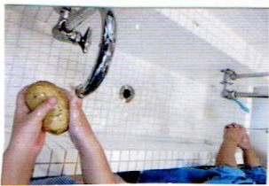
じゃがいもを洗いました！

{野菜は淡路島産玉ねぎ・北海道産じゃがいも・京都産人参} {国産鶏もも肉} {市販固形カレールー・市販豆乳} を使用しました。