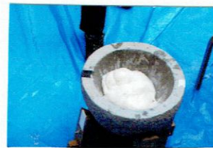
つきあまりました。