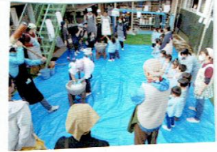
お米を ほくして、ぺったんぺったん おもちつき。