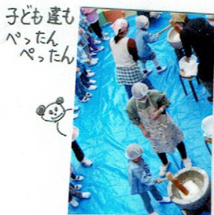
子ども達も ぺったん ぺったん