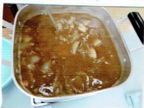
美味しい美味しいカレーのできあがりです。