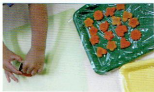
人参をハートや☆の形に型抜きしました。