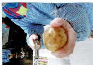
じゃが芋の皮をむいています！