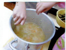
ルーをおなべにいれています