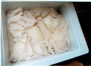
ふかしたての もち米

たくさんのお父様お母様にお世話になって、おもちつきを楽しむことができました。よいしょよいしょとお父さんお母さん達のお餅つきを応援！力強いお父さん達のお餅つきをお手本に子ども達も、杵を持ってぺったんぺったんおもちをつきました。もち米がお餅になっていく様子に感激！ついたおもちをころころまるめました。お母さんたちが作って下さった美味しい砂糖醤油餅にきなこ餅。おなかいっぱいいただきました。それぞれが心をこめてまるめたおもちをおみやげに持って帰りました。お味はいかがでしたか？企画準備からお世話いただきましたPTA 役員の皆様、お手伝いいただきました保護者の皆様、ありがとうございました