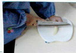
包丁もこんなに上手につかえるよ！