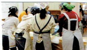
お母さん達の さとうしょうゆもち