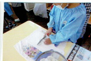
人参 ジャガイモ 大根 皮をむいて切ります