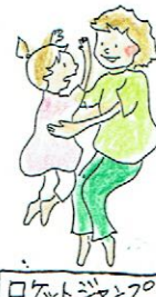
ロケットジャンプ