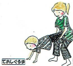
ておしくるま (ばんださん から) きりんさん