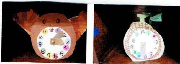
きりんさんの とけい