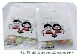
ひなあられのおみやげ