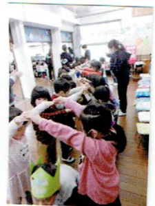
トンネルをとおりました。