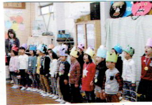
ようちえん たのしかったよ!!