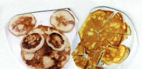
ことりさん、うさぎさんへ 大きな大きなホットケーキ!!