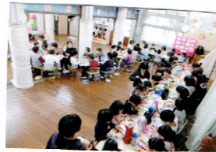
みんなでランチをいただきました。