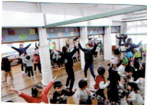
♪ ♪ ♪