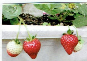
四季苺いちごが実をつけました。