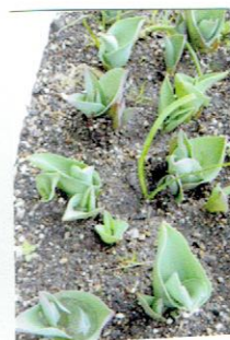
チューリップの芽