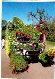
ネコバス 菊の花を ていようよ！

お庭の柿の木もオレンジ色に色付き、百日草もピンク色やオレンジ色がより鮮やかになり種もいっぱいとれました。今年の10月はお天気が今ひとつの日が多かったのですが、お天気の良い日には、植物園や賀茂川や公園にお散歩に出かけたたくさん遊びました。