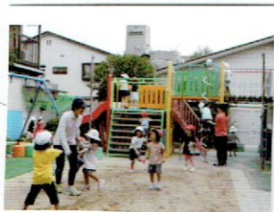
先号と おもちゃと