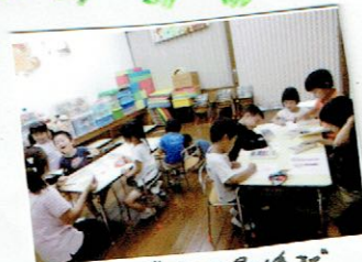
集中して最後まで