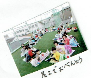
屋上でおべんとう