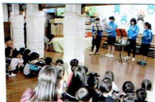
サマサホン、ユーホニウム、パカッションによるコンサート。素敵な演奏を聴かせてくれました。

それぞれ大変意欲的に活動していました。生徒さんたちは、多くを学んでくれたことでしょう。今後を大いに期待しています。