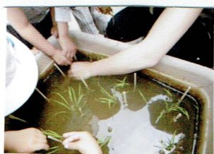
今年も田んぼから苗をいただき プランター田んぼにうえました。