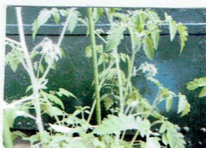
トマトの 苗を植えました。