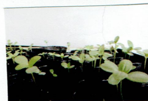
きりんさんは百日草やひまわり を種から育てます。