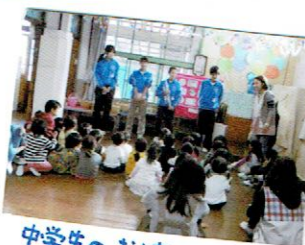
中学生のおや市さん