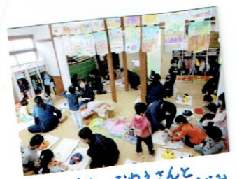
高校生のおねえさんとぱんだごみ

7日～11日中学生がチャレンジ体験学習 6月に引き続き30日には高校生が保育体験 (家庭科)を行いました。 それぞれ大変意欲的に活動していました。 生徒さんたちは、多くを学んでくれたこと でしょう。今後を大いに期待しています。