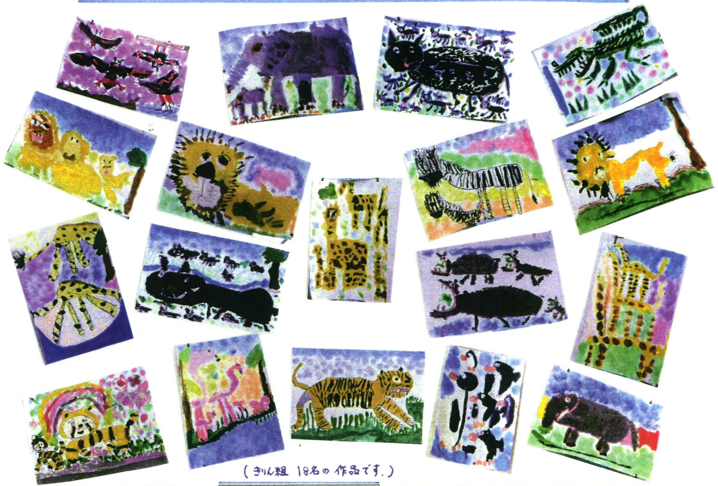
(きりん組 18名の作品です。)