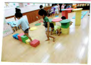
つみ木も並べてコースを つくったよ.