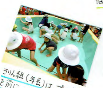
きりん組(年長)は、プール開き を前に きれいにプールを みがいてくれました.