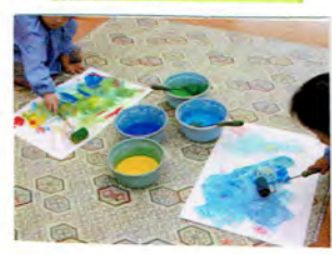
ローラーでころころ おもしろいナ.