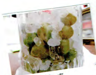
お庭の梅の実 梅シロップを作ったよ(きりん組)