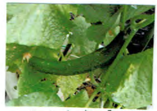
きゅうりも 大きくなりました.