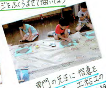
専門の先生に 指導を してもらって、土粘土の 造形に挑戦(きりん組)