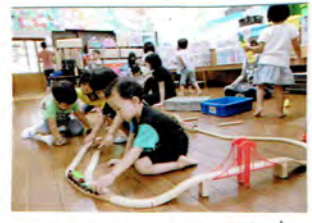
レールをつなげて、つなげて いつも人気No.1の 汽車!!