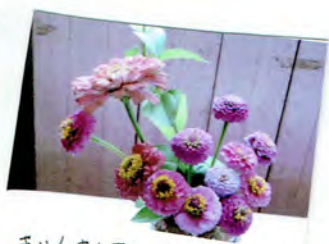
きりんさんたちが 大切に育てた 百日草。たくさん花が咲きました