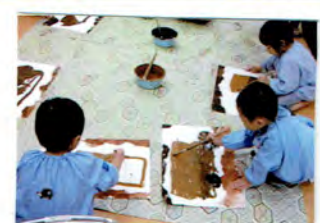
ふたをきいて イメージをふくらませて描いてます.