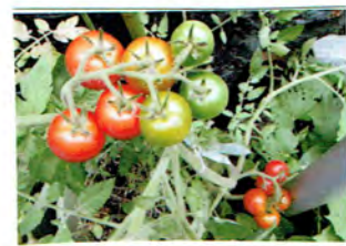
トマトが たくさんできました.