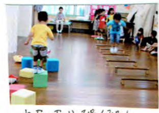
ねだったり ひなんひなん じんだり