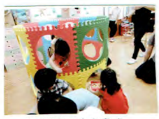
おおきな おうちだよ.