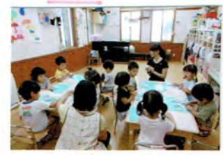
みんなで粘土であそぼう