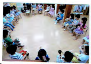
8月 いろいろな楽器でリズムをとうり