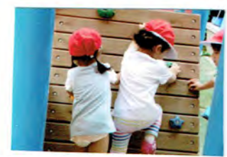
よいしょ、よいしょ よいしょ 高いとびる平気よ!!