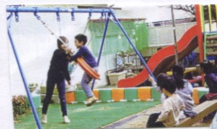
おにのて ブランコ