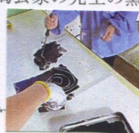
(きりん組11月) 紙版画を刷っています