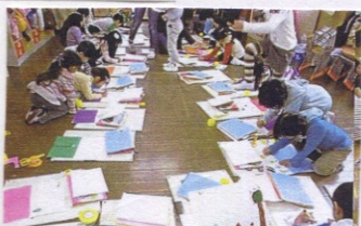
絵本をよんでいます。(きりん組.12月)

きりんさんは春からいろいろなことに取り組みました。行事や遠足を経験する毎にコツコツ作り貯めた様々なしなかけが楽しい思い出絵本。紙版画の版のつくりを理解し船岡山での消防祭りで観たり乗ったりした消防自動車、はしご車を版にし、自分で刷り上げた紙版画。様々な木を使い、かなづちで釘を打ったりボンドで飾りを貼り付けたり、会心の作の木工作品。夏、専門の先生に指導してもらったの粘土遊びで出来上がったそれぞれの顔のレリーフは陶芸家の先生の窯でそれぞれの好みの色にやきあげてもらいました。ひとつひとつが宝物です。