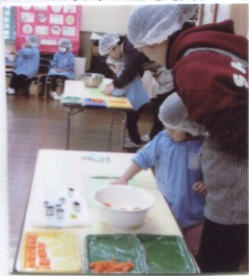
人参をハートや☆の形に型抜きしました。型抜きした後の人参は細かく切っておなべに入れてにこみます