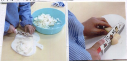
包丁もこんなに上手につかえるよ!