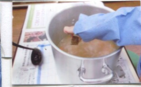
ルーをおなべにいれています。