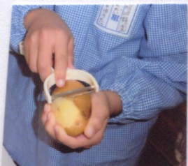
じゃが芋の皮をむいています!

{野菜は淡路島からいただいた玉ねぎ・北海道産じゃがいも・京都産人参}{国産鶏もも肉}{市販固形カレールー}{無調整 豆乳}を使用しました。