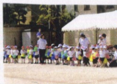
うさぎ組 みんなであそぼう！