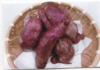
ようちんのおいも!!!