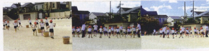
ぼんだ組 みんなげんきだ！リズム遊び！