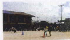
保護者競技 ～愛のラケットリレー～