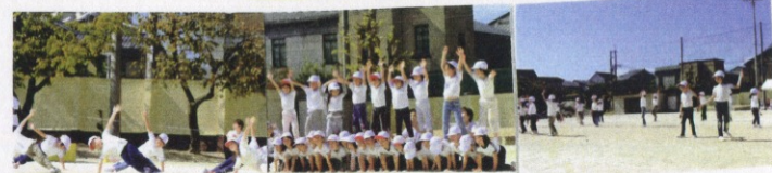
きりん組 きもちをひとつに！