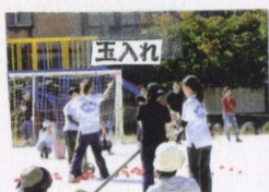
熟年の皆さん・会場の皆さん