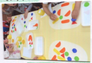
のりもつかってみよう(N)