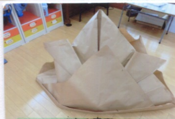
みんなで作った大きなかぶと