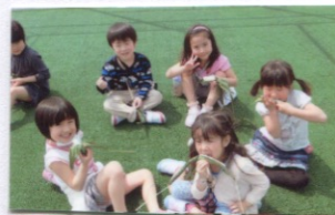
屋上でちまきもいたっているとう(A)