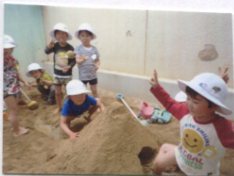
大きなお山ができたよ