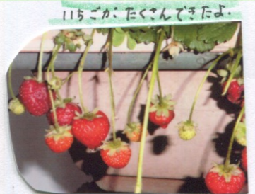
いちごが、たくさんできたよ。