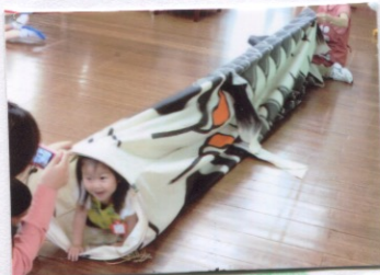
このほりの トンネルよ！！